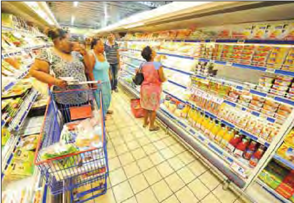
La mission sénatoriale déplore « le manque de concurrence dans le secteur de la grande distribution ».