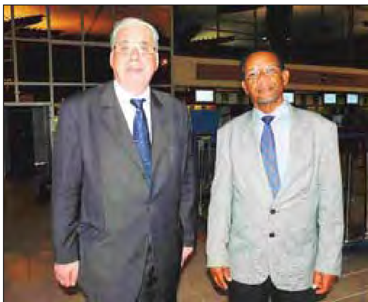
Les sénateurs Jean-Pierre Sueur (à gauche) et Félix Desplan lors de leur visite à La Réunion, en mars. Ils insistent sur « l'urgence d'agir » contre la vie chère.

Côté fiscalité, elle suggère une baisse des taxes sur les produits de première nécessité,