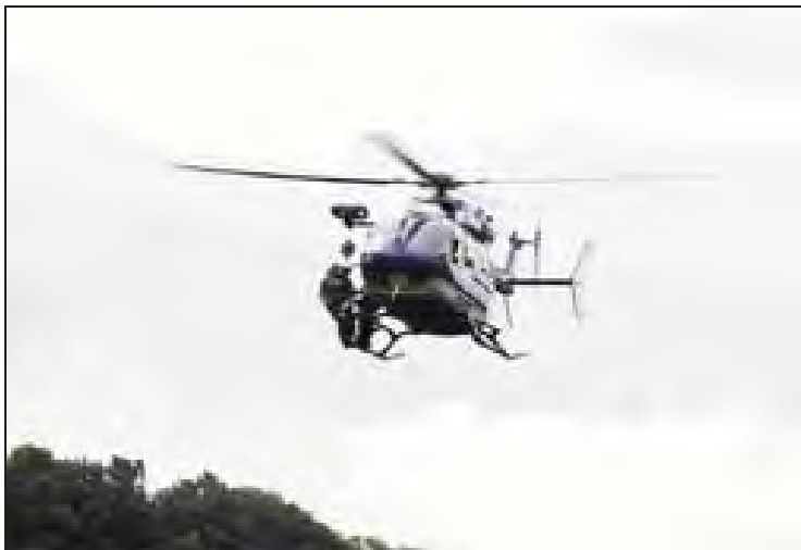
Un deuxième hélicoptère affecté au Sdis, en plus de celui de la Gendarmerie nationale, permettrait « de détecter et d'anticiper les incendies », pour les sénateurs.