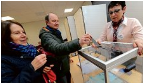
INGRÉ. Des électeurs plus matinaux qu'au premier tour.

Propos recueillis par Stéphanie Cachinero