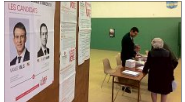
MONTARGIS. Le bureau de vote était dans la salle Pasteur.