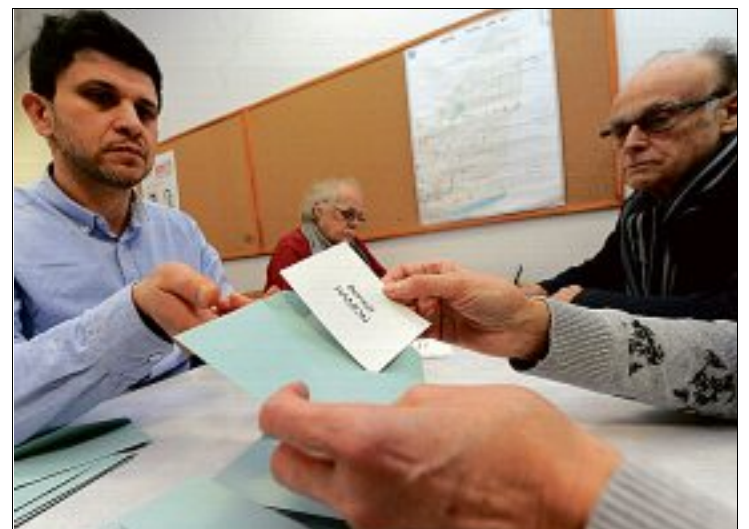
ORLÉANS ARGONNE. Benoît Hamon l'a emporté avec 69,49 %.