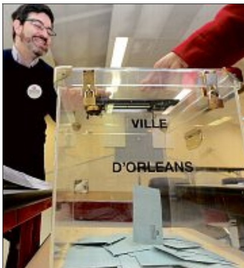
ORLÉANS-BLOSSIÈRES. À midi, 99 bulletins déposés dans l'urne, contre 78 dimanche dernier.