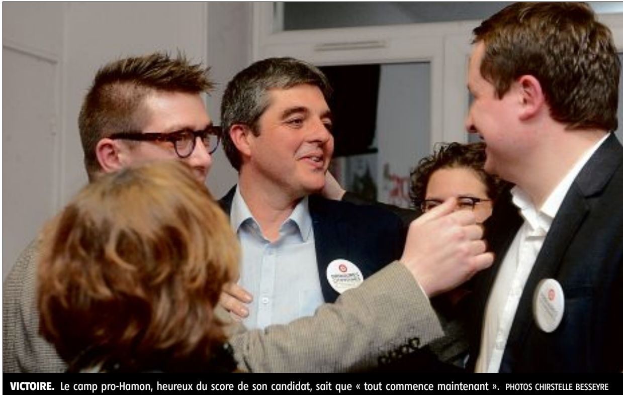
VICTOIRE. Le camp pro-Hamon, heureux du score de son candidat, sait que « tout commence maintenant ».

Avant même que le verdict des urnes ne tombe, des cerveaux étaient en ébullition, voire en surchauffe. « Tous ceux qui se réclament de la ligne centre gauche vont avoir du mal à soutenir Benoît Hamon, bien à gauche. On voit déjà des élus PS qui ne savent plus trop où ils en sont, et qui ont des attentes par rapport à Emmanuel Macron », confie un militant PS, qui pourrait bien se laisser séduire par les sirènes macronien-