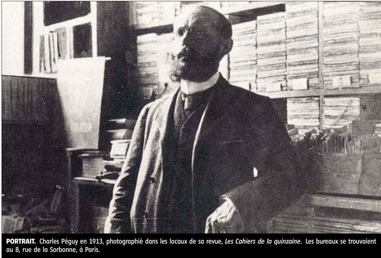
PORTRAIT. Charles Péguy en 1913, photographié dans les locaux de sa revue, Les Cahiers de la quinzaine . Les bureaux se trouvaient au 8, rue de la Sorbonne, à Paris.