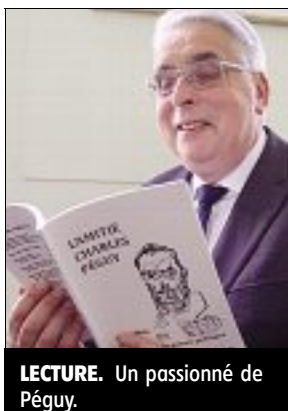
LECTURE. Un passionné de Péguy.

■ En quels termes en parle-t-il ? Il a été profondément marqué par la vie au faubourg Bourgogne, où il a grandi avec sa mère et sa grand-mère, rempailleuses de chaises. Il a été façonné par le peuple, ses racines paysannes. Dans « Victor-Marie comte Hugo », il écrit : « En moi, autour de moi, dessus moi, sans me demander mon avis, tout concourt à faire de moi un paysan non point du Danube, ce qui serait littéraire encore, mais simplement de la vallée de la Loire, un bûcheron d'une