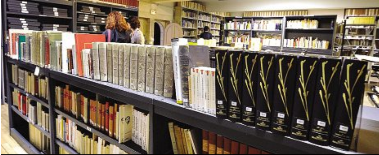
CENTRE CHARLES-PÉGUY. La structure rénovée permet de découvrir des archives des Cahiers de la quinzaine, 1.200 lettres de correspondance, 320 manuscrits : que de trésors littéraires !