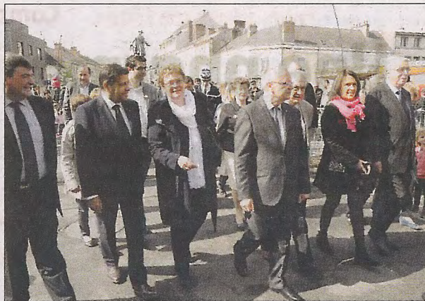
À événement important, personnalités importantes