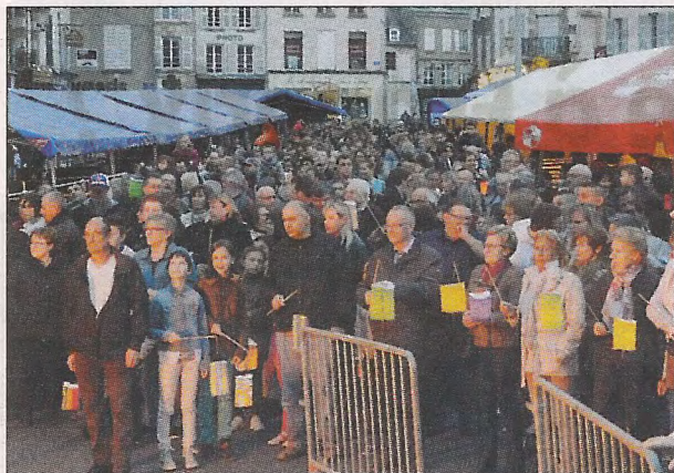
Vendredi, la place du Martroi était noire de monde