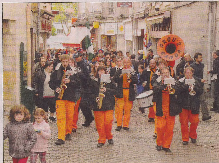
Esprit festif et soleil dans les rues au son de la banda.