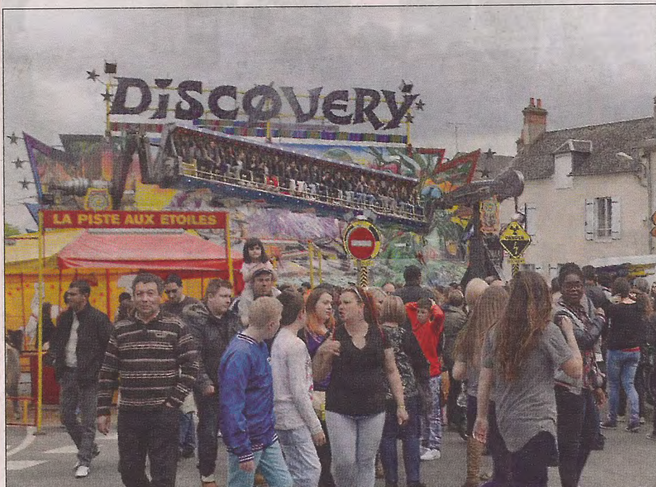
Discovery, l'une des attractions vedette à sensation.