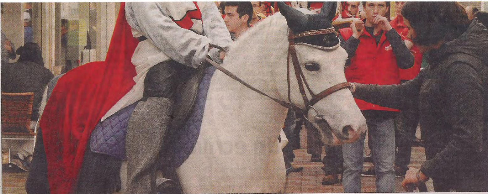
Sur son fier destrier, Saint-Georges a conduit le cortège inaugural de la foire, samedi matin.