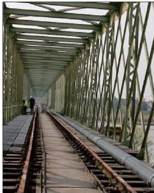
Dans quelques mois, les cyclistes et piétons pourront emprunter le pont de chemin de fer en toute sécurité.