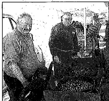
La cuisson des châts