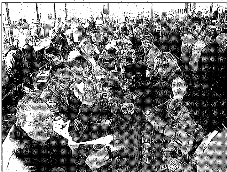
Les grandes tables sous la halle

Manège forain, commerces ambulants ont apporté un plus à cet atmosphère de fête.