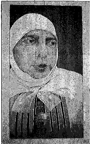
« Gille » : Portrait à l'huile de Dominique Luque.

Exposition d'art couleurs et formes à la grange du Prieuré les 11,12, et 13 novembre de 14 h à 18 h 30.