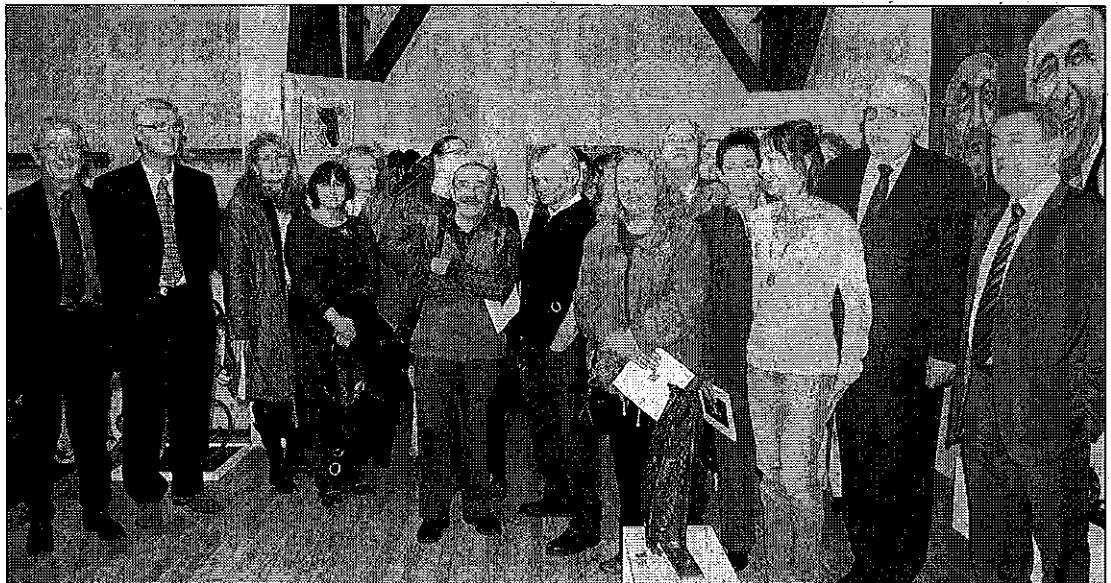
Artistes et élus rassemblés pour la traditionnelle photo souvenir