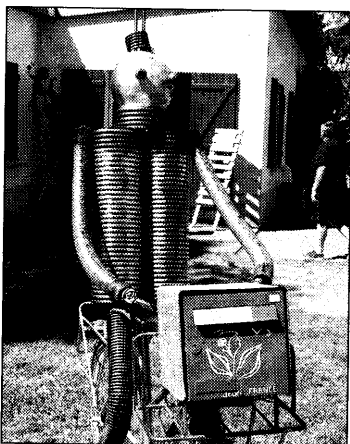
Le robot facteur

Une vache sur un timbre ! C'est la direction de la communication de La