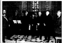
De nombreux élus et personnalités étaient présents pour l'occasion.