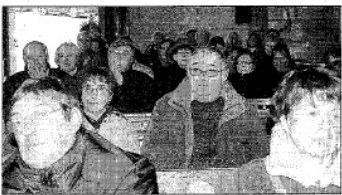
Une partie du public, parmi lequel de nombreux donateurs.